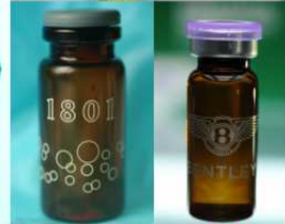
Mephedrone (喵喵)、 bk-MDMA、MDPV (浴鹽) 等安非他命類毒品