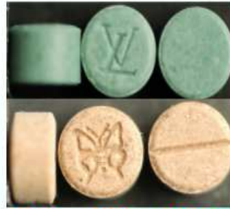
MDMA、MDA、PMMA 等安非他命類毒品