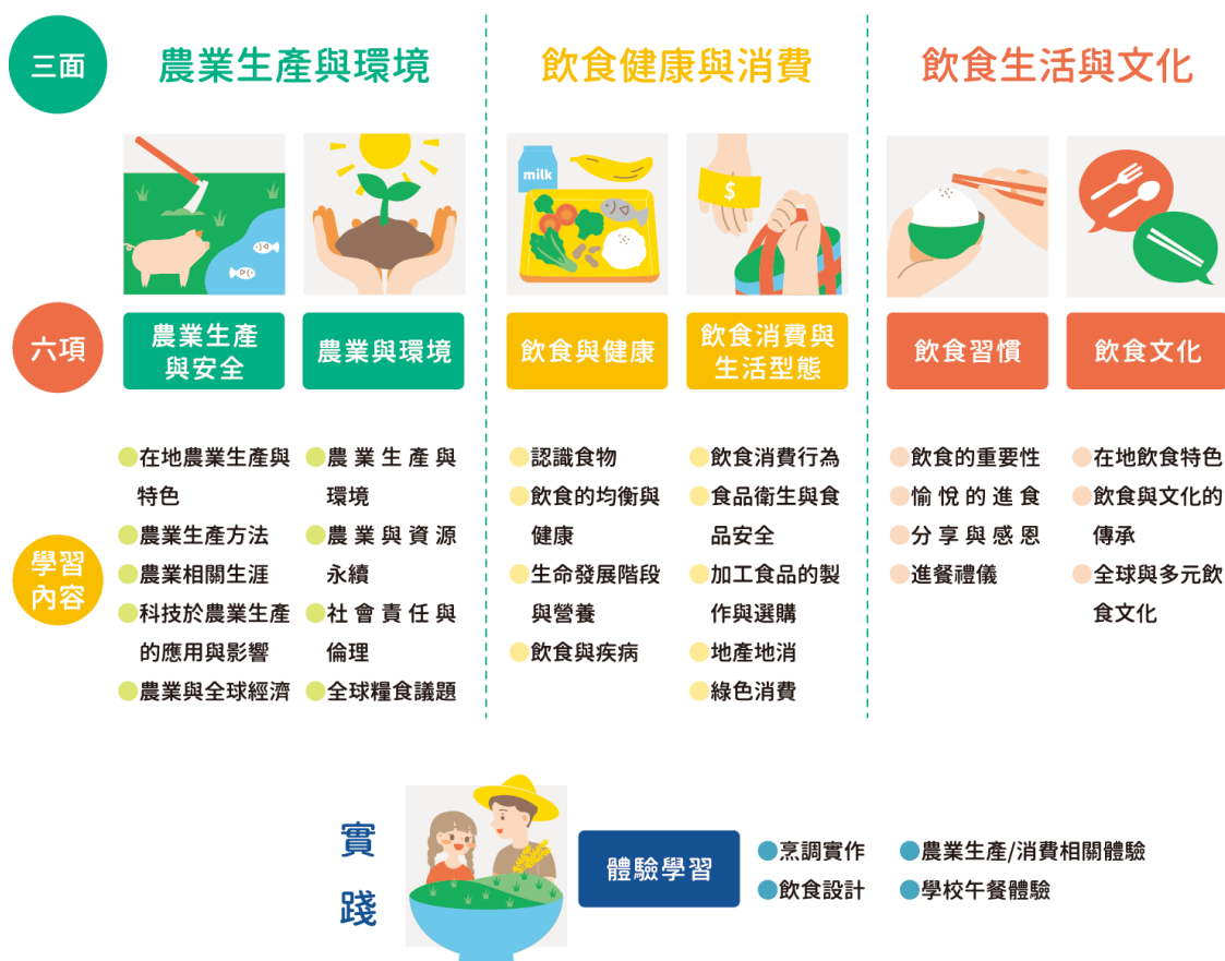
圖 1 食農教育概念架構及學習內容